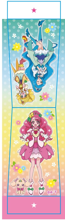
【キャラクタープレートパーツ】

⚠ 注意 (ちゅうい) ●ハサミを使用する部分がありますので、お取扱いには注意してください。